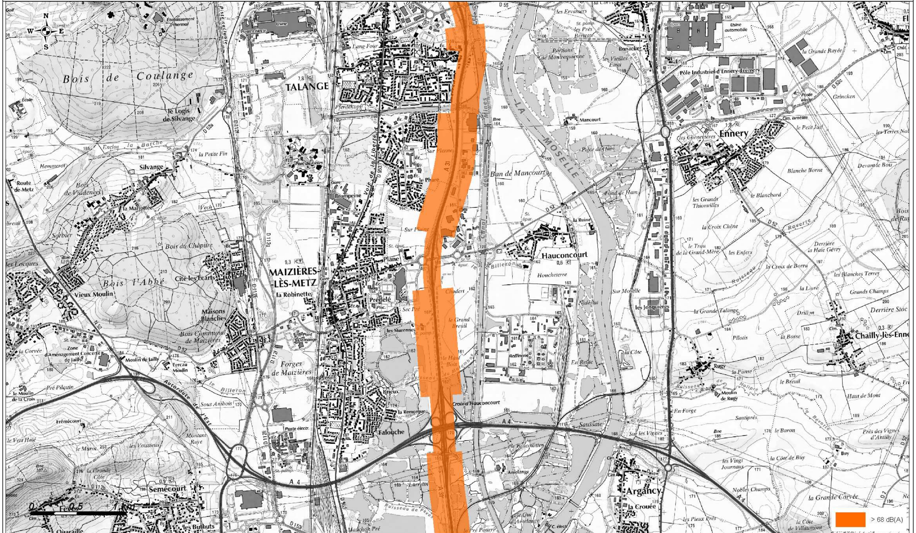
Carte de Bruit Stratégique 2012 Carte de type C- Indicateur Lden (Jour, Soir, Nuit)