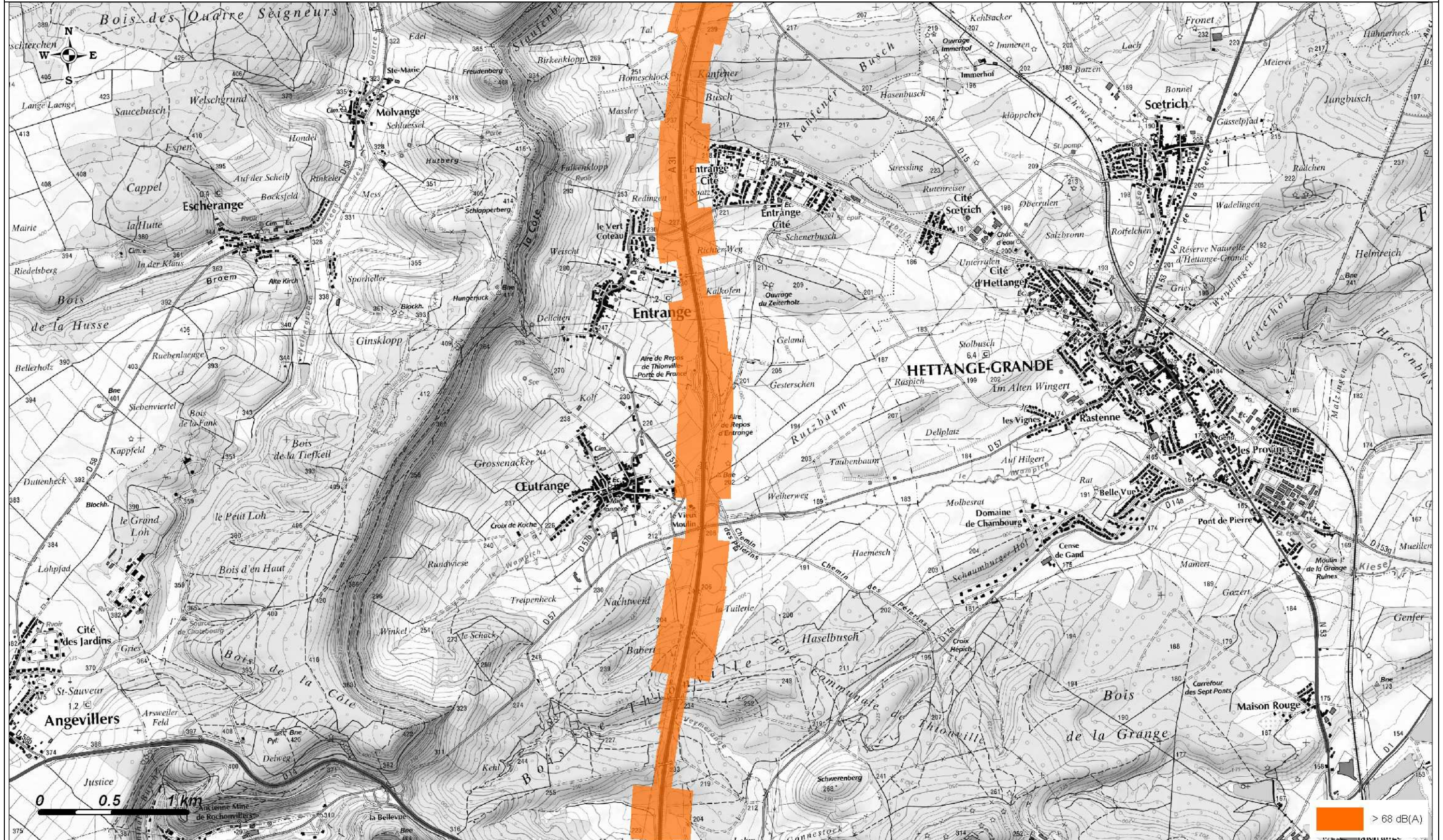
Carte de Bruit Stratégique 2012 Carte de type C- Indicateur Lden (Jour, Soir, Nuit)